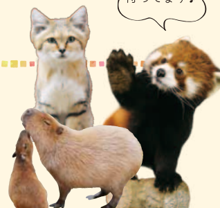
僕たちが待ってます♪

毎日どうぶつたちによるショーやパフォーマンスを開催しており、楽しいショーやふれあいの中でどうぶつ本来の能力や知能の高さを間近で体験することができます。