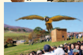
▲バードパフォーマンスショー