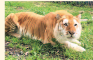
ふれあいイベントももりだくさん!!

至近距離で野生動物のエサやりができる体感型サファリ。人間が檻に入ってサファリを探検できる新感覚のアクティビティバス【WILD RIDE】が人気です。