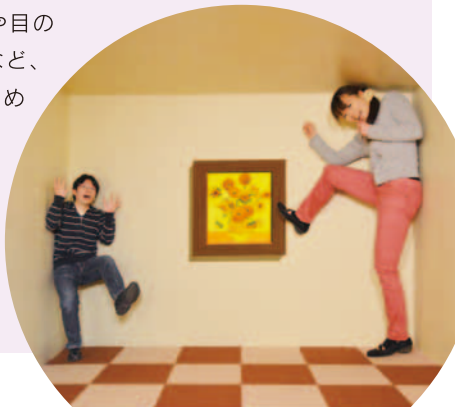
ポーズを決めて写真を撮ろう！面白い写真がいっぱい撮れます

立体的に見える絵画や目の錯覚を利用した作品など、ちょっと不思議で楽しめる『体験型アート』を、ぜひ体験してください。