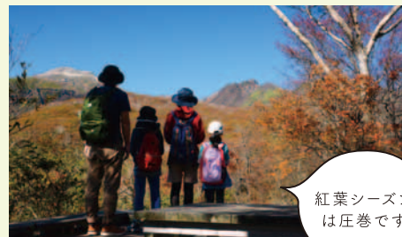
紅葉シーズンは圧巻です

那須を象徴する雄大な那須五峰。今でも噴煙を上げる茶臼岳を中心に大小いくつもの山々が折り重なり、四季折々、個性豊かな表情を楽しませてくれます。